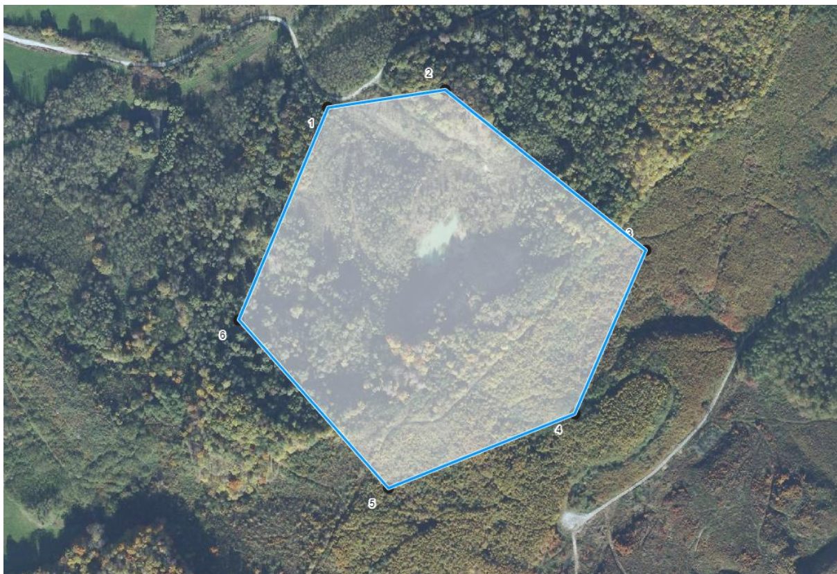
Grafički prikaz traženog istražnog prostora građevnog pijeska i šljunka "Lješčara"